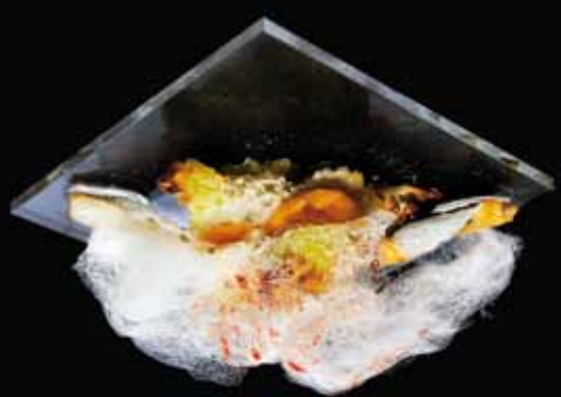
Pincho ganador 2015 por el Bar Ábaco

Del 10 al 19 de abril Apirilaren 10etik 19ra 2015