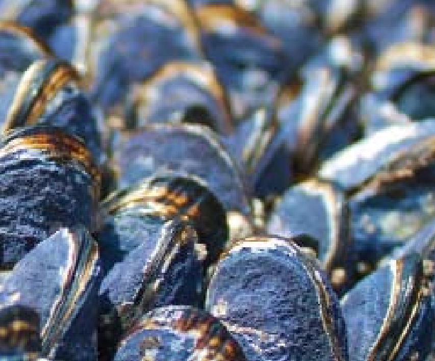
200 KILOS DE CLÓCHINAS (MEJILLONES) SE SERVIRÁN EN LA EXPLANADA DEL IVAM