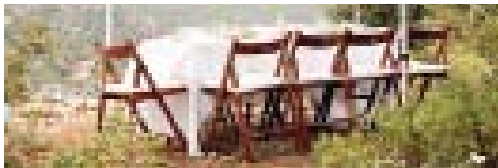
LA COMPOSICIÓN DE UNA MESA SERÁ UNA DE LAS REFLEXIONES